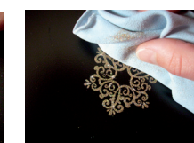
mit Lappen losen Glimmer entfernen