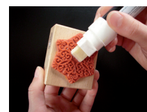
mit Marker Haftlack auftragen