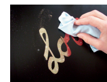
mit Lappen losen Glimmer entfernen