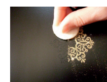
mit Pad Glimmer auftragen