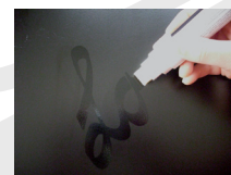
mit Marker vorschreiben