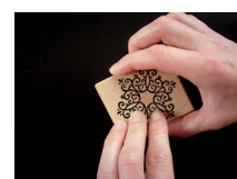
auf die gewünschte Unterlage stempeln